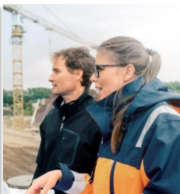
Endret kundeadferd og økte forventninger