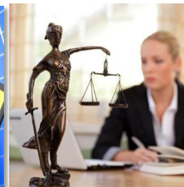
Økende krav til reguleringer